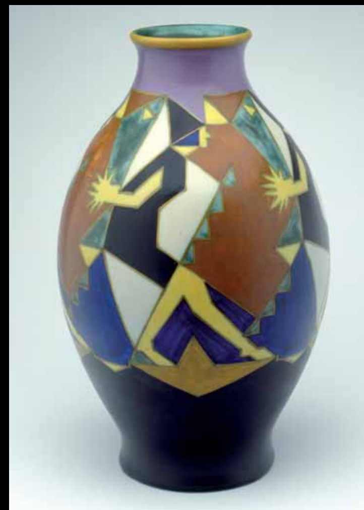
5 museumgoudA/Het Catharina Gasthuis Siervaas Variété, 1924 Plateelbakkerij Zenith, Gouda