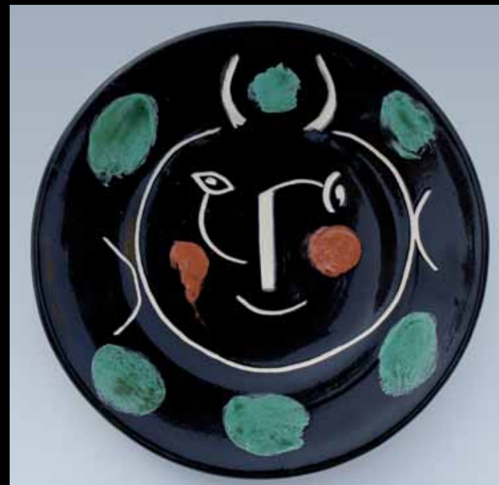
Keramische borden Pablo Picasso, Bruce McLean en Tom Wesselmann