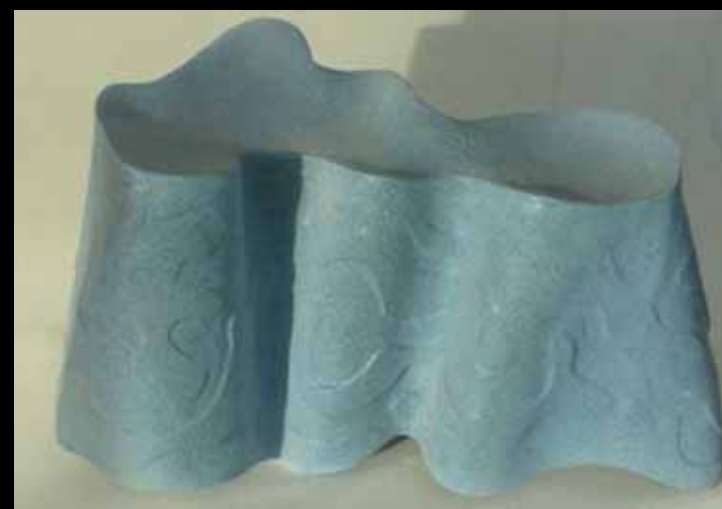
Keramiek EIGEN STIJL: