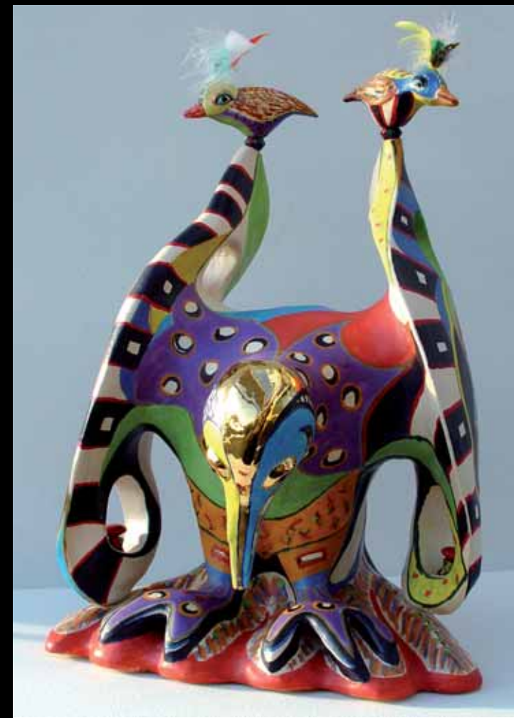
9 Galerie/Atelier De Hollandsche Maagd Vogel, keramiek, mat plateel/goud, Maps Färber

Hobbywinkel met o.a. Sprookjeswol, wol-vilt en pakketten Wilhelminastraat 38, Gouda, 0182 551130 wo-za 10.00-17.00 do 13 mei gesloten, vr 14 mei open