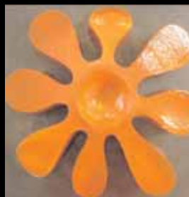
7 Huisgalerie De Drie Spieringen Expositie Keramiek EIGEN STIJL